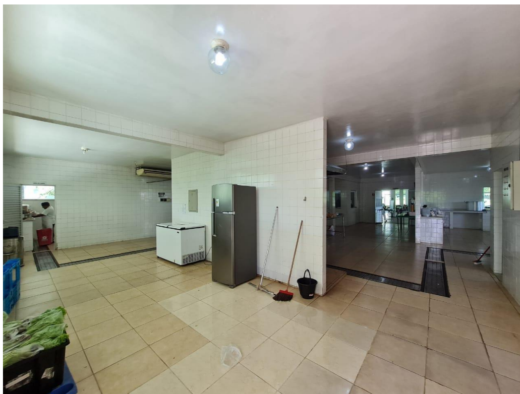
Imagem 09 – Área de recepção dos insumos