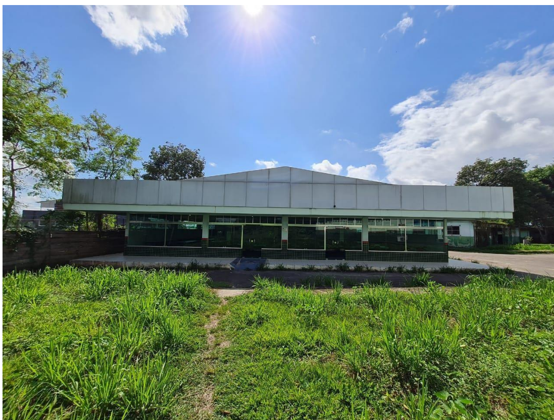
Imagem 03 – Fachada do refeitório