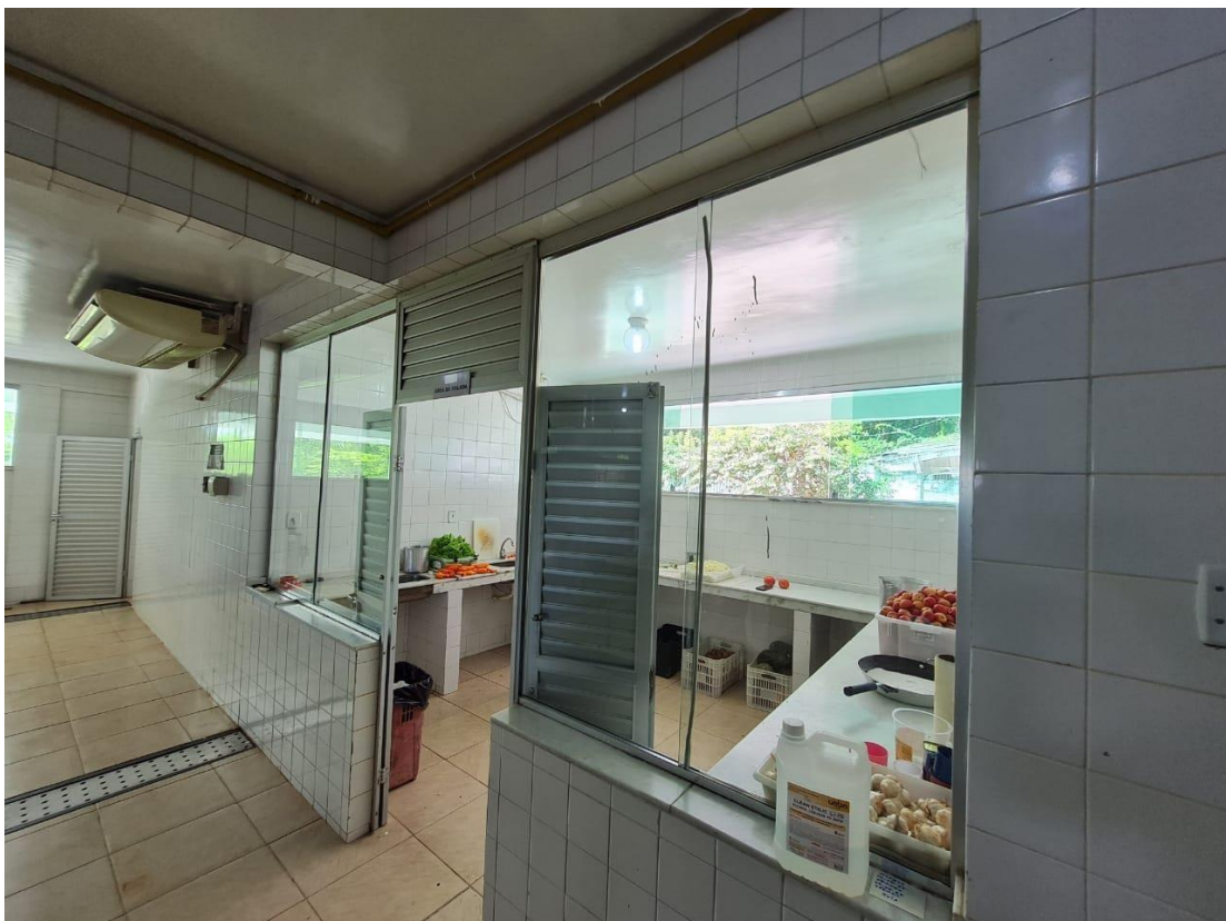
Imagem 12 – Hortifruti