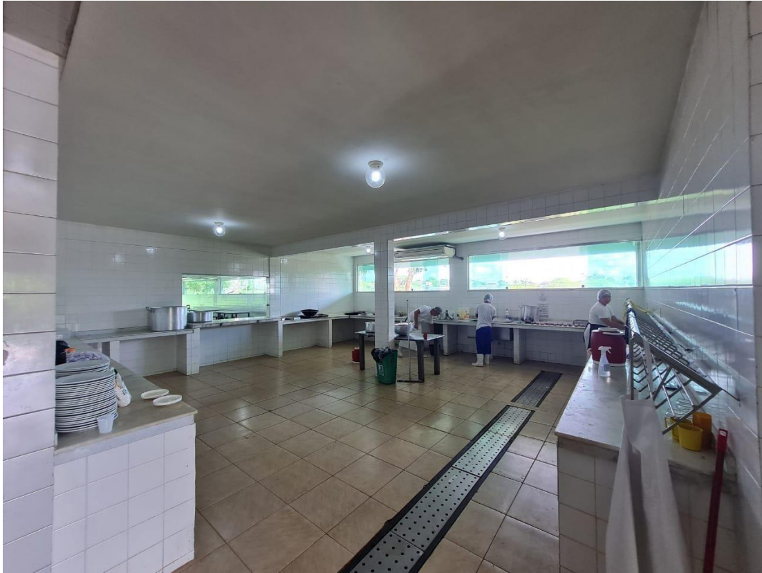
Imagem 17 – Lavagem de panelas