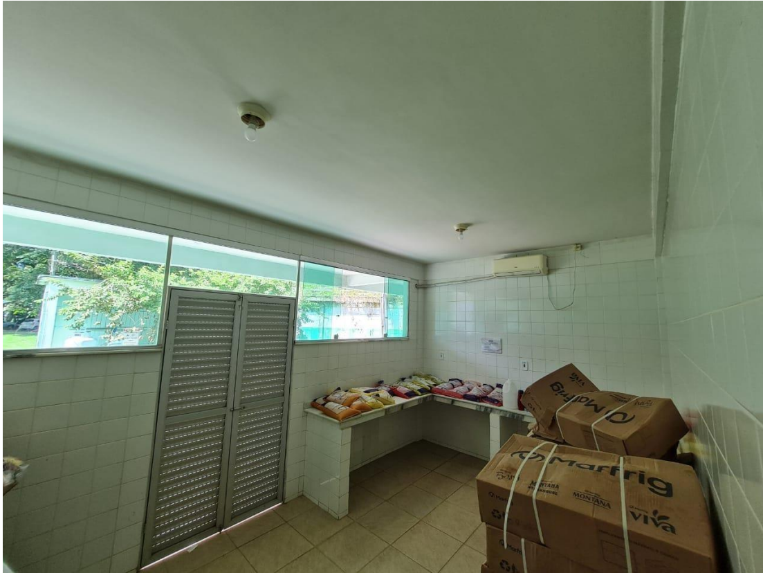
Imagem 11 – Açogue