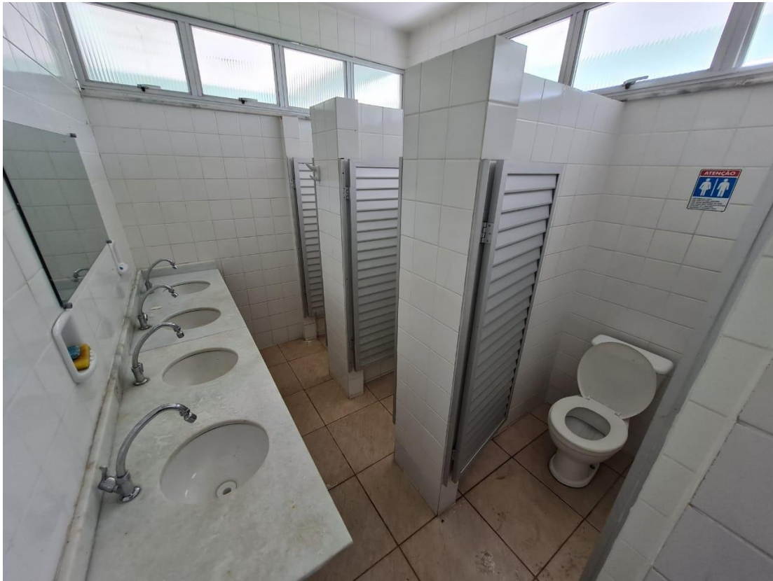
Imagem 21 – Banheiro