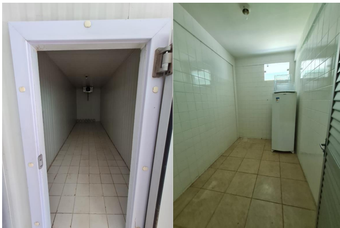
Imagem 10 – 1 câmara de resfriamento, 1 de congelamento; depósito