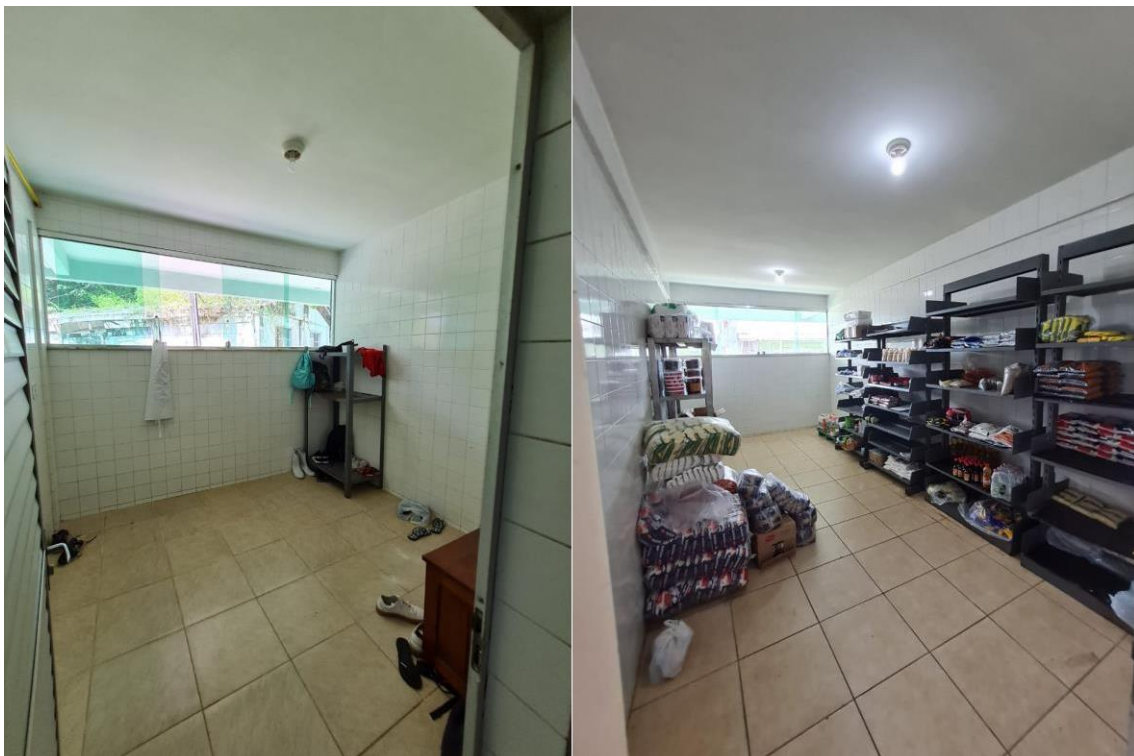
Imagem 16 – Vestiário; Estoque de alimentos não perecíveis