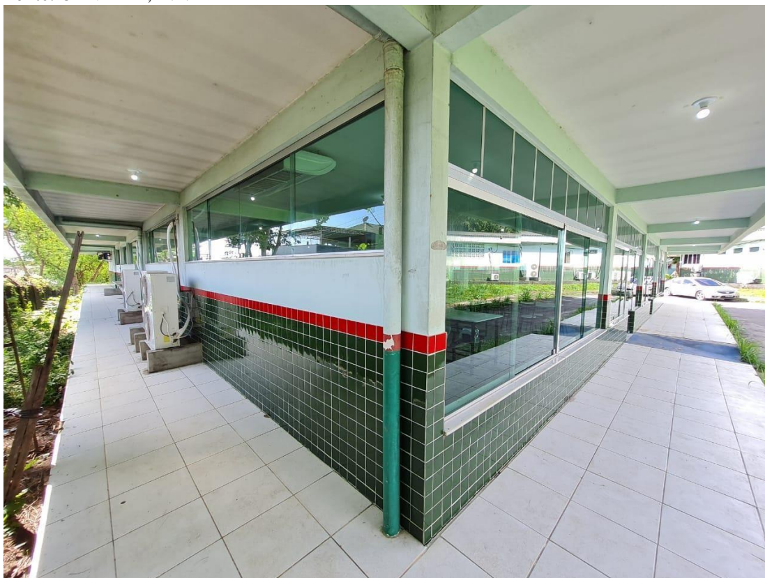
Imagem 04 – Frente e lado A do refeitório