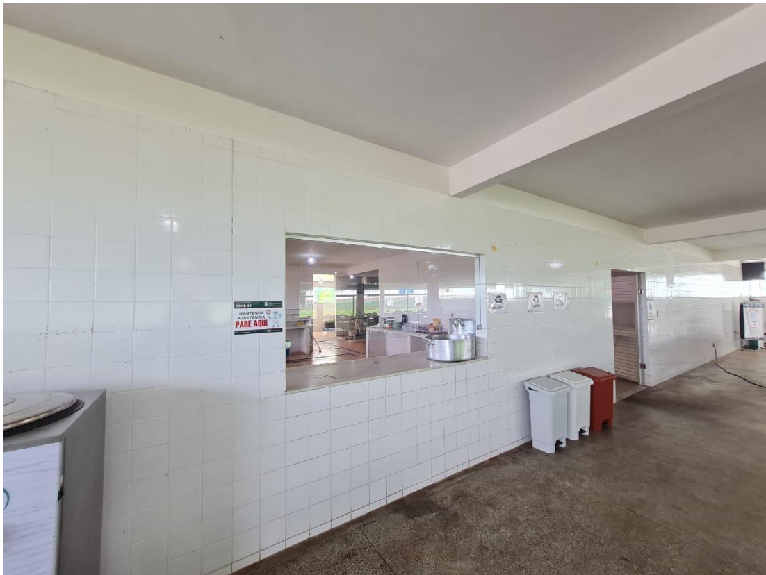
Imagem 20 – Refeitório