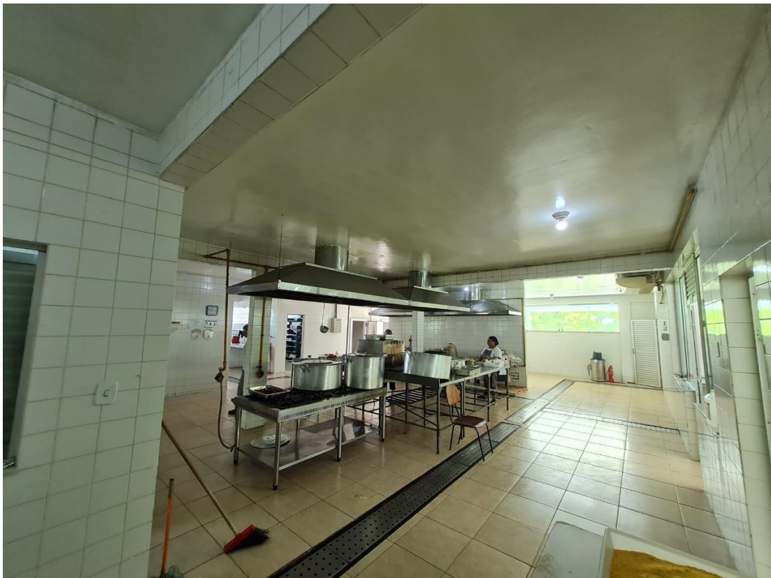
Imagem 14 – Área de cocção