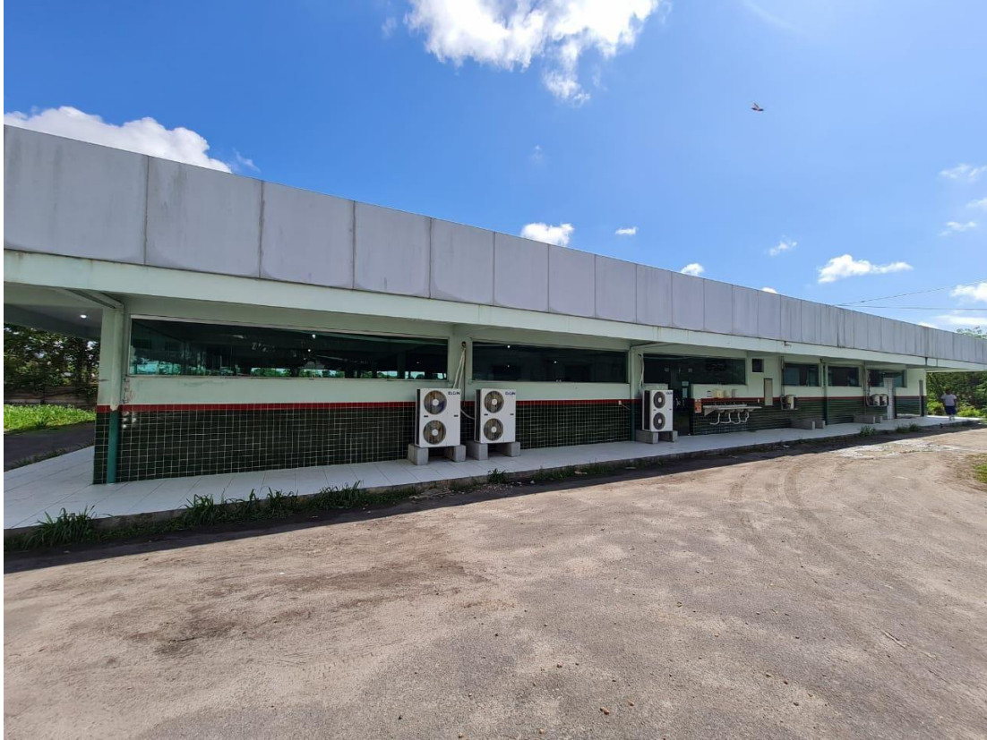
Imagem 05 – Lado B do refeitório