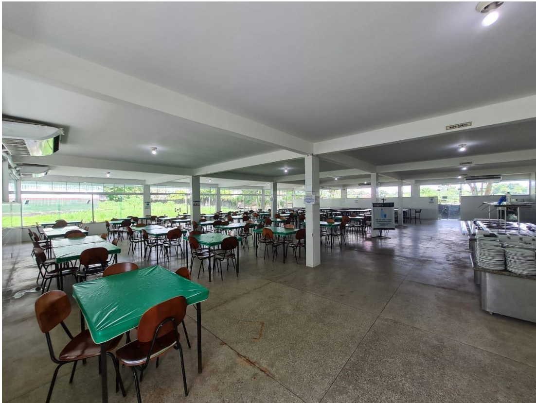
Imagem 19 – Refeitório