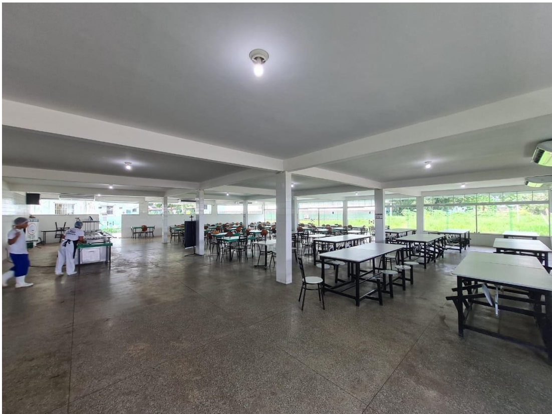
Imagem 18 – Refeitório