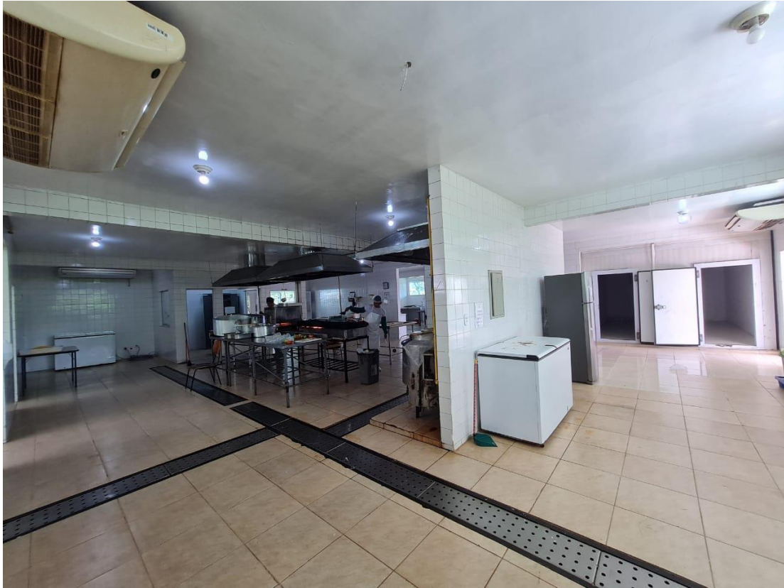
Imagem 13 – Área de recepção