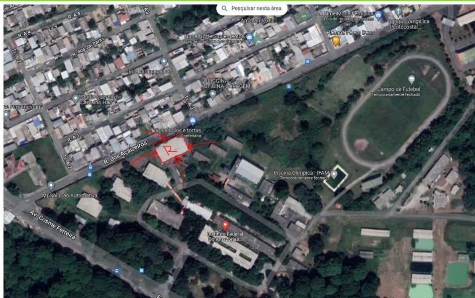
Imagem 01 – Localização do Refeitório do Campus.