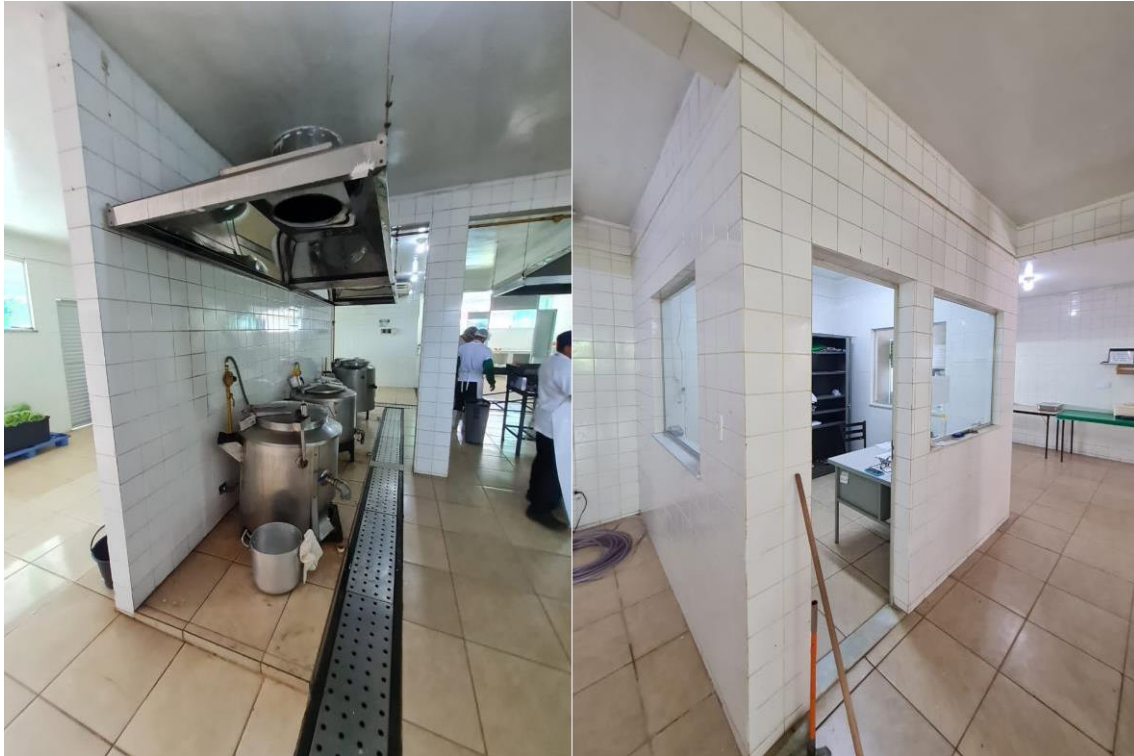
Imagem 15 – Área de cocção; sala administração