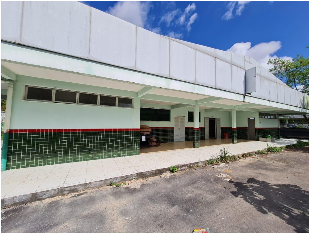
Imagem 07 – Fundo do refeitório