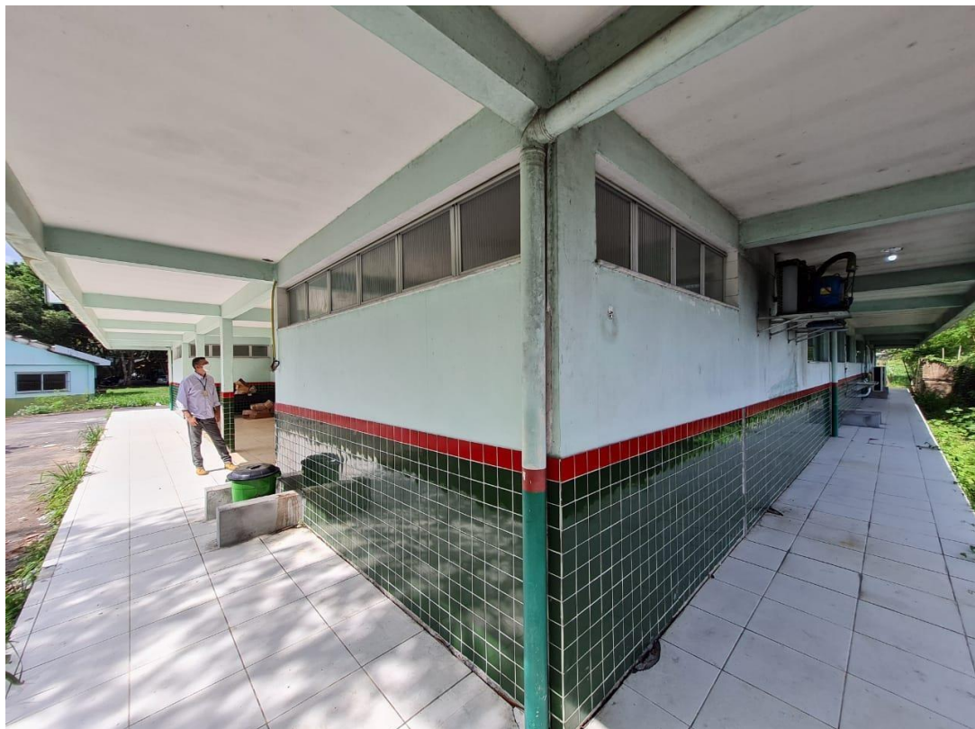
Imagem 08– Fundo do refeitório e lado B