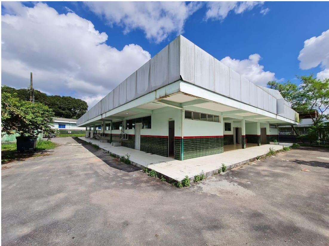
Imagem 06 – Lado B e fundo do refeitório