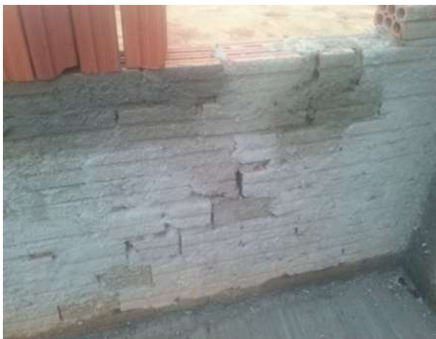
Fotografia 20 – Rachadura da Alvenaria da Secretaria Escolar