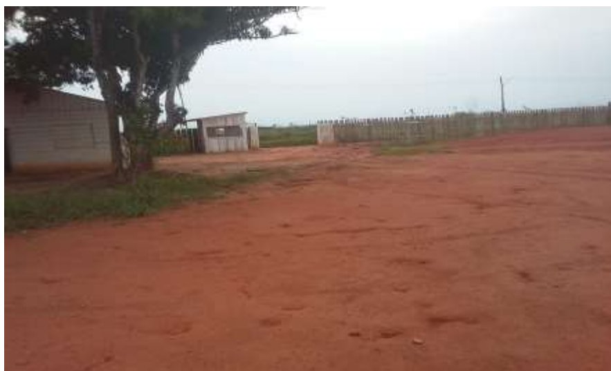
Fotografia 18 – Vista do Barracão de Obra e Guarita