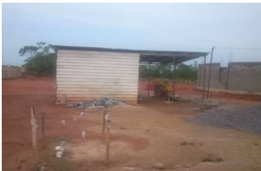
Fotografia 16 – Vista da Central de Concreto (Deposito de Materiais)