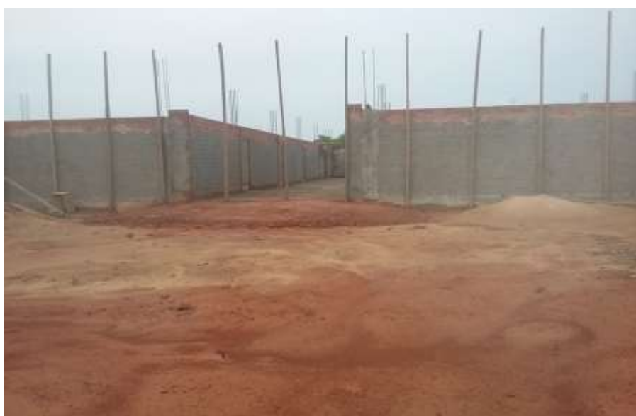
Fotografia 14 – Vista da Ala Direita