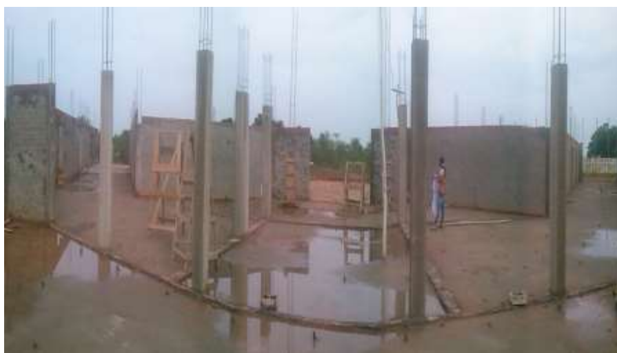
Fotografia 4 – As fundações do prédio principal já foram executadas.