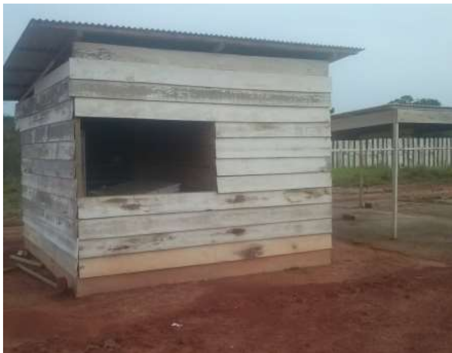
Fotografia 17 – Vista da Sala do Mestre de Obras