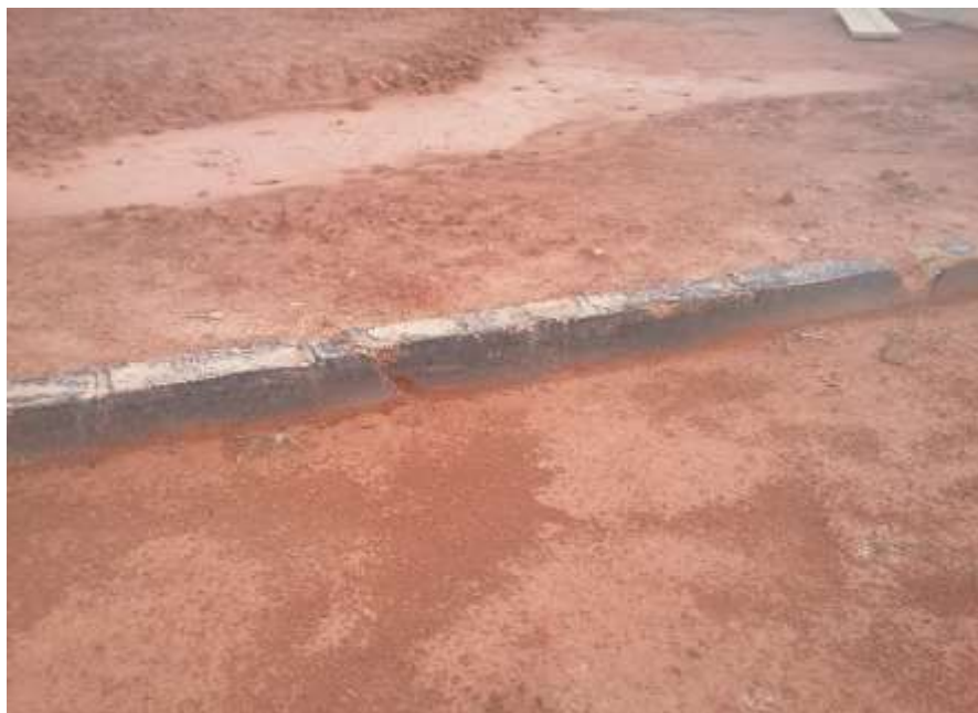
Fotografia 21 – Rachadura e trincas na Viga Baldrame do Espaço de Convivência, com ferragem exposta em diversos pontos.