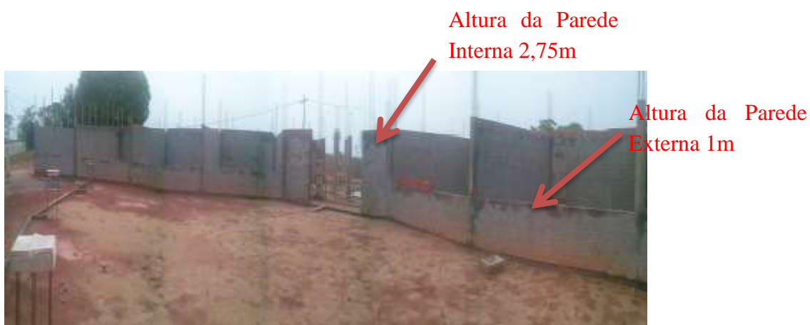
Fotografia 12 - Vista das paredes Internas e Externas. As paredes que dividem as salas do prédio já estão executadas até a altura de 2,75m. As paredes externas estão executadas até a altura de 1,00m, exceto as paredes dos banheiros que estão executadas a uma altura de 2,15m.