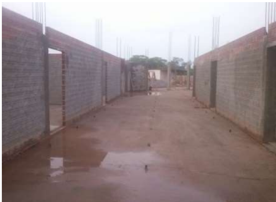
Fotografia 9 – Vista corredor da Ala direita (Sala de aula)