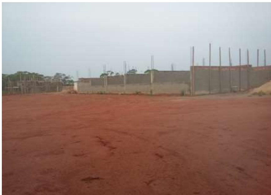
Fotografia 15 – Vista das Salas de Aula da Edificação