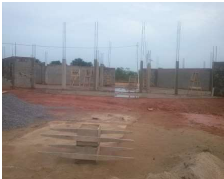
Fotografia 5 – Os pilares do pavimento térreo do prédio já estão concretados, exceto: P3, P4, P8, P9, P31 e P32, que deverão ser revisados e finalizados quanto à forma, ferragem e concretagem.