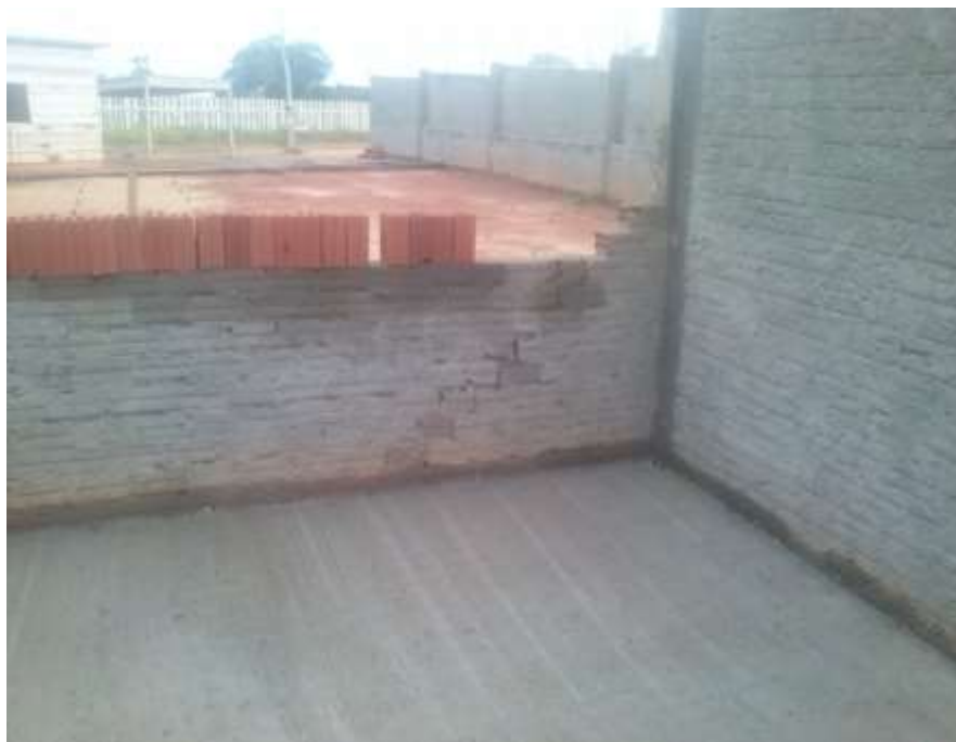
Fotografia 19 – A alvenaria externa da Secretaria Escolar apresentando rachaduras e trincas. Deverá ser refeita, pois a mesma está comprometida.