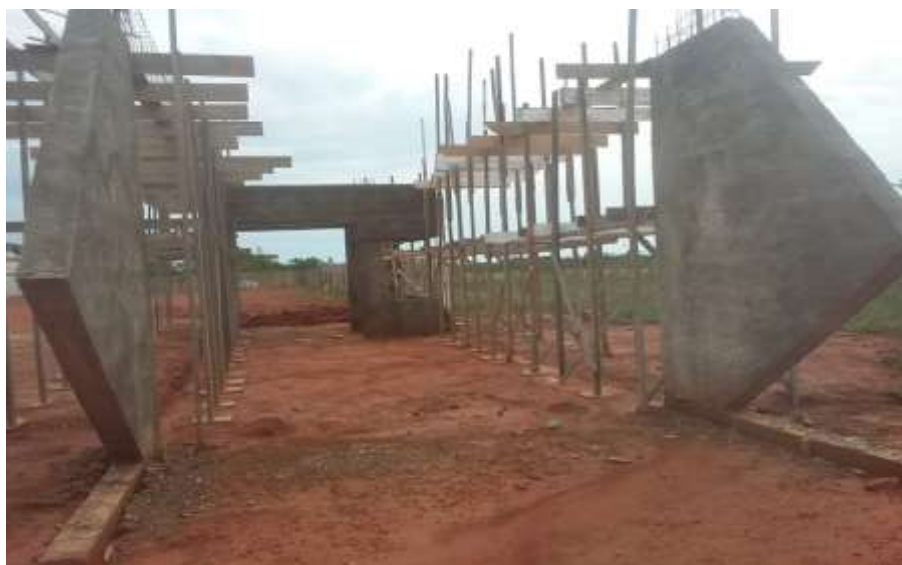
Fotografia 2 – Vista lateral direita da Guarita (Fundações Concluídas e Parte da estrutura).