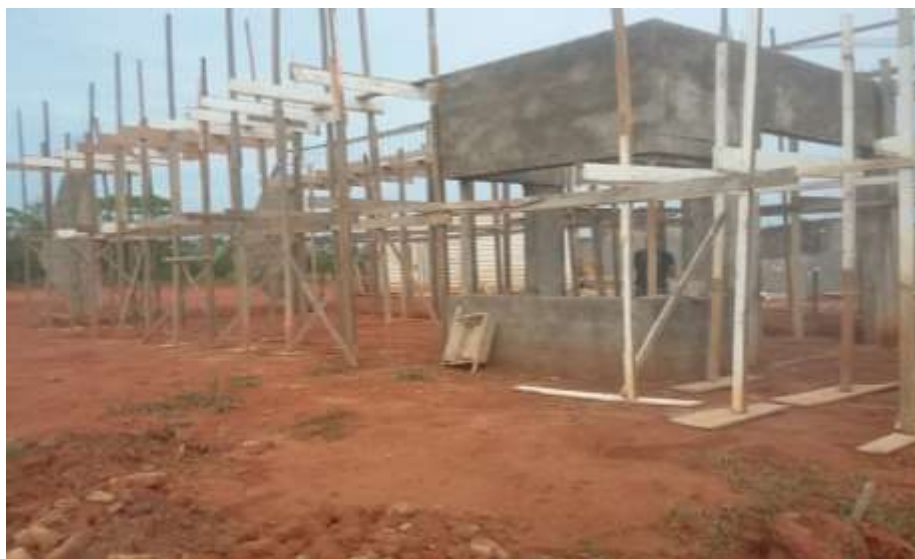
Fotografia 3 – Vista Frontal da Guarita.