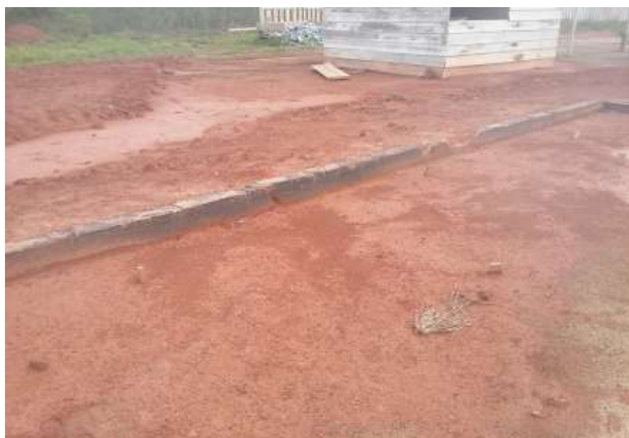
Fotografia 22 – Vista da Viga Baldrame do Espaço de Convivência