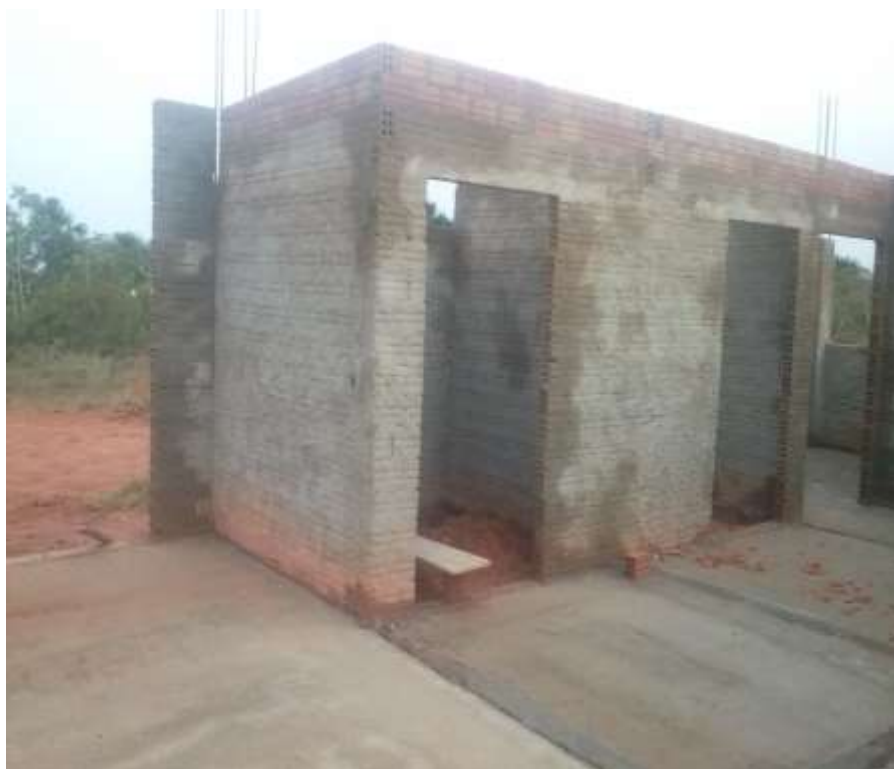
Fotografia 11 – Vista Interna área administrativa (Ala Esquerda) dos Banheiros