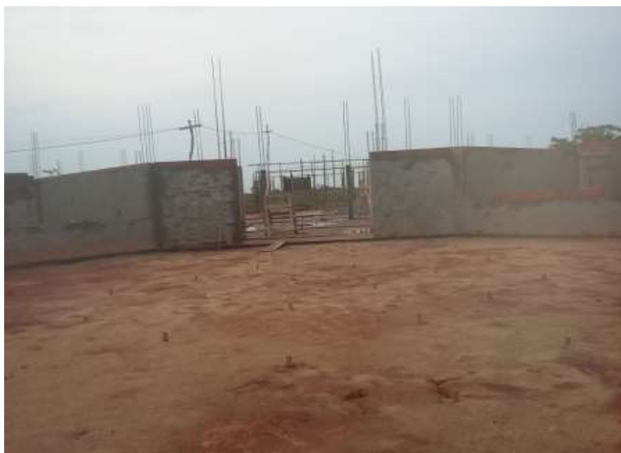
Fotografia 13 – Vista Posterior da Edificação Principal