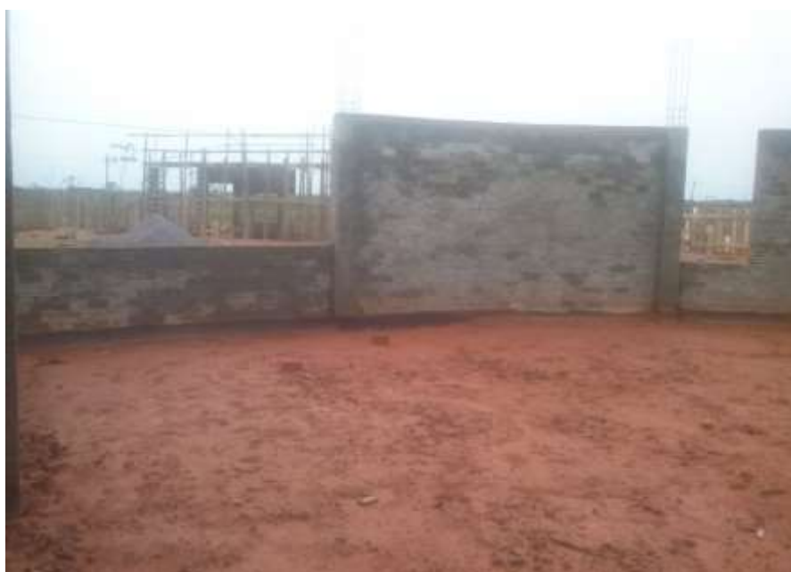
Fotografia 10 – Vista Interna do Auditório